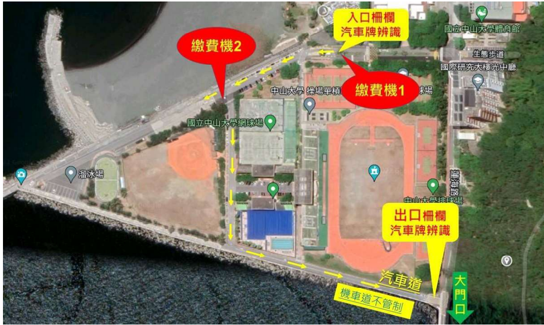
圖 2、海堤停車場繳費機位置