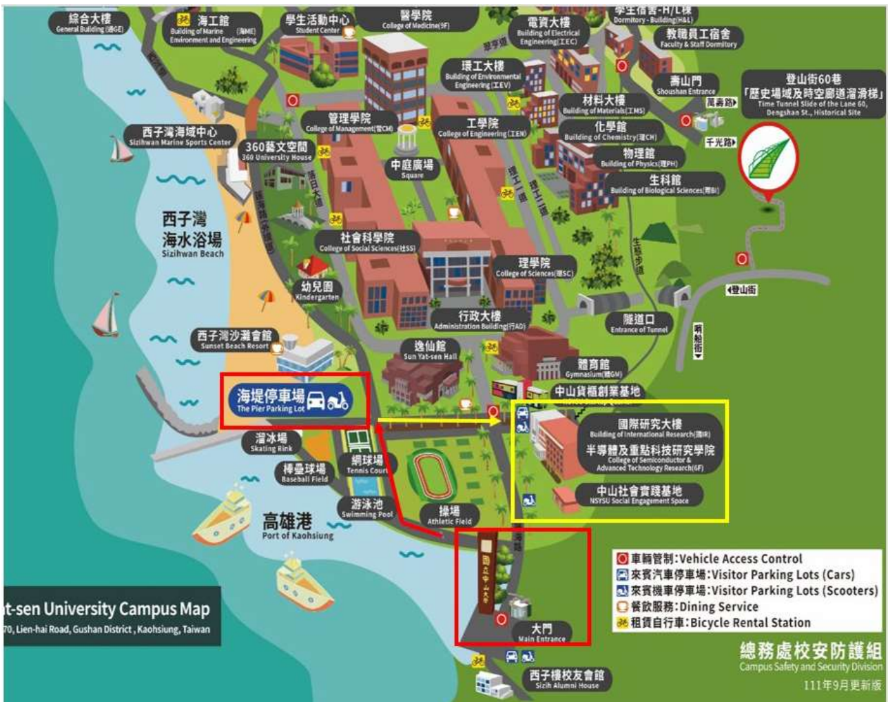
圖 1、海堤停車場與會場往返路線

小型車 15 元/30 分鐘，當日最高收費為 150 元；大型車：40 元/30 分鐘，當日最高收費為 240 元。須至繳費機繳費（停車場入口處、棒球場旁，詳見圖 2），繳費方式包含現金、電子支付（如悠遊卡、一卡通、信用卡等）。